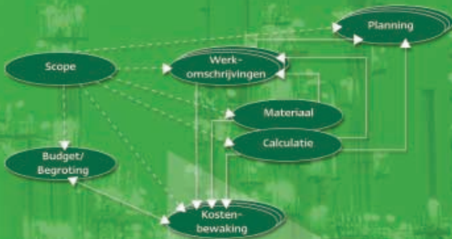
Disciplineoverzicht met onderlinge samenhang